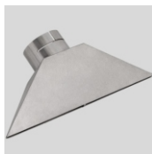
Obj.č. 4024 Štěrbínová tryska 300 x 5 mm